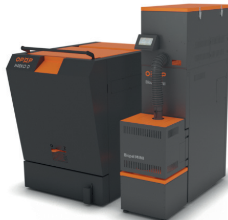
BIOPEL MINI KOMBI TOWER CA

Set BIOPEL MINI KOMBI spojuje všechny výhody peletového kotle BIOPEL MINI a zplynovacího kotle na dřevo H4EKO D. Řídicí jednotka je umístěna v horní části BIOPELU MINI a řídí vytápění peletami i kusovým dřevem.