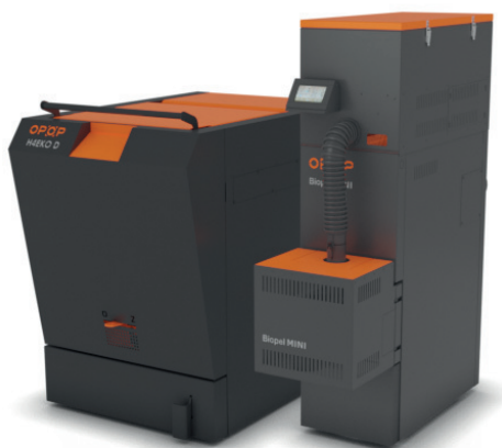
BIOPEL MINI KOMBI TOWER