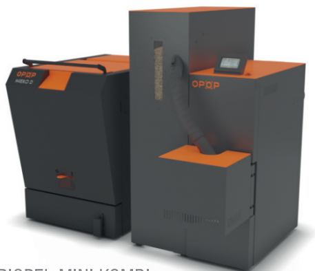
BIOPEL MINI KOMBI