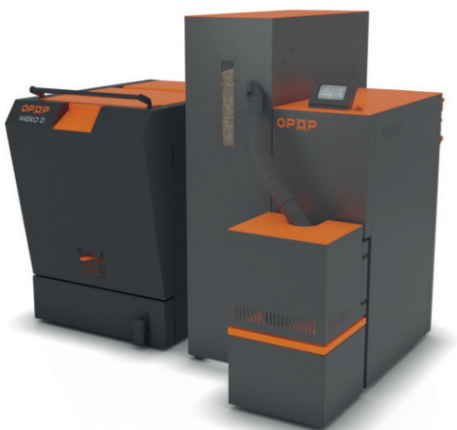
BIOPEL MINI KOMBI CA